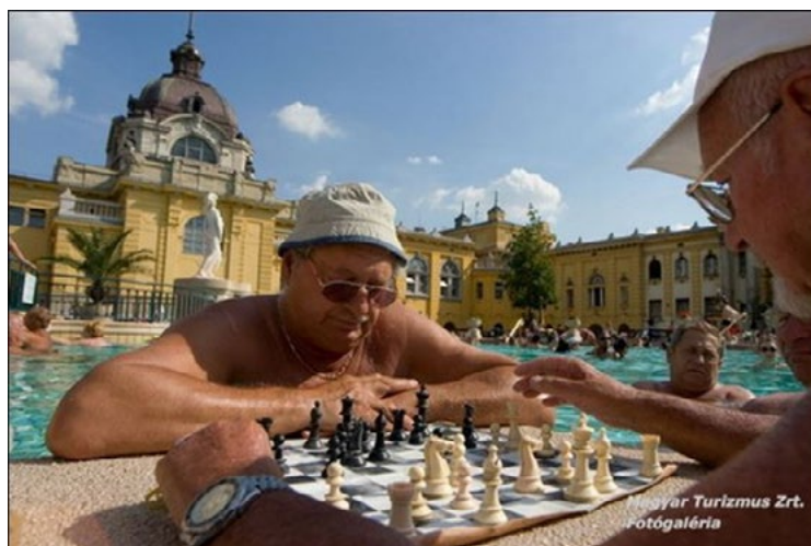
Foto: Scacchisti in una vasca termale dell'antico stabilimento Széchenyi, a Budapest.